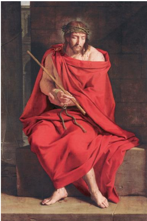
Philippe de Champaigne (1631-1681), Le Christ aux outrages, vers 1650.

Se levant alors au milieu, le Grand Prêtre interrogea Jésus : « Tu ne réponds rien ? Qu'est-ce que ces gens attestent contre toi ? »